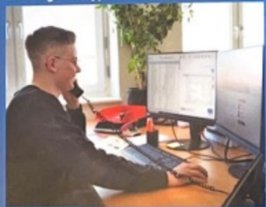
Wer Kaufmann/-frau für Groß- und Außenhandelsmanagement wird, telefoniert auch viel mit Kunden und Lieferanten.